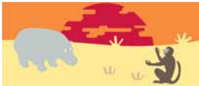
Série Savane (4 tableaux)