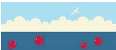
Série Maritime (4 tableaux)