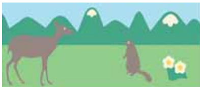
Série Altitude (4 tableaux)